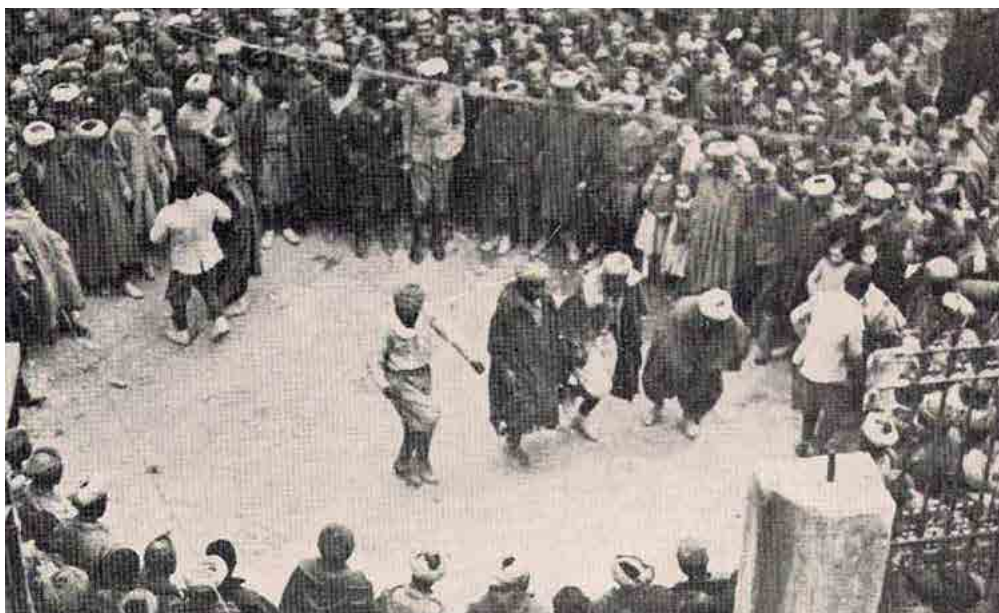
Tropas rebeldes con musulmanes festejando la toma de Mora de Rubielos. Fecha: julio de 1938.