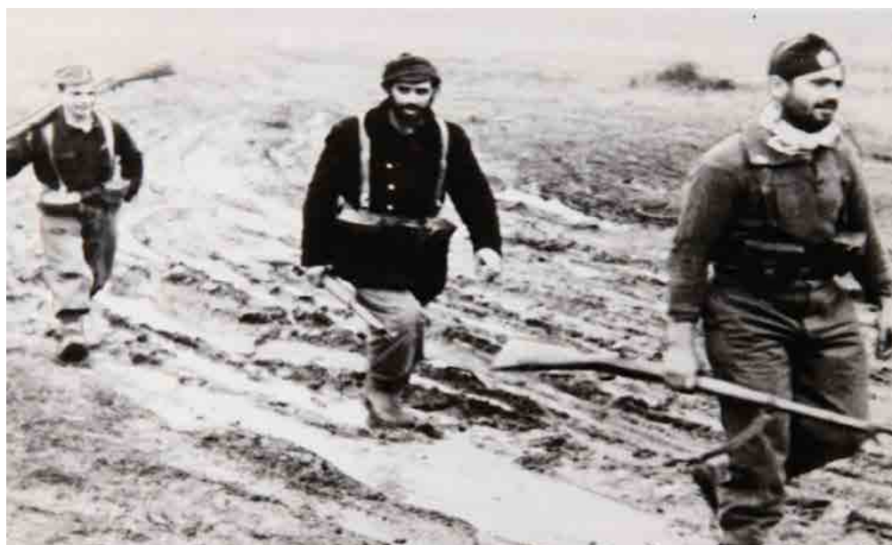
Republicanos en la Batalla de Teruel. Fecha: 1937-1938.