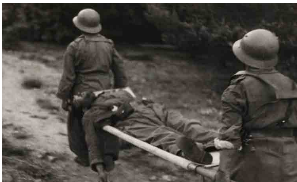
Los soldados republicanos con un soldado en una camilla en Navacerrada. Fecha: 1937. Autor: Gerda Taro. Fuente: https://www.nytimes.com/slideshow/2007/09/21/arts/20070922_TARO_SLIDESHOW_9.html