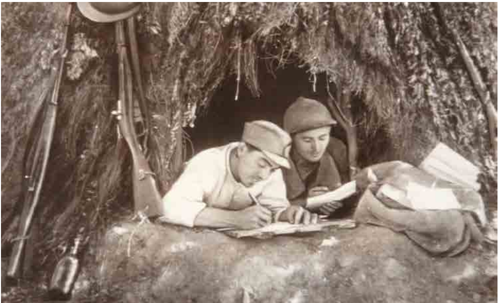
Milicianos del General Miaja escribiendo cartas. Fecha: 1937. Autor: Desconocido. Fuente: Colección Museo Nacional Centro de Arte Reina Sofía.