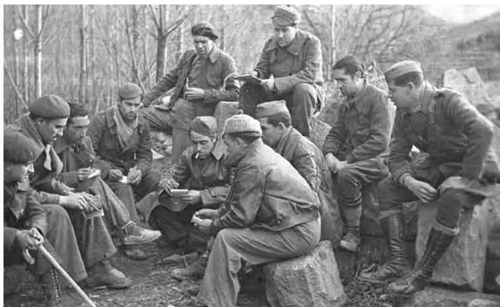
Guerra en España: nuestro ataque dará comienzo a las 22:43 del día h. Soldados republicanos en el frente. Fecha: 1936-1939. Foto empleada como portada.