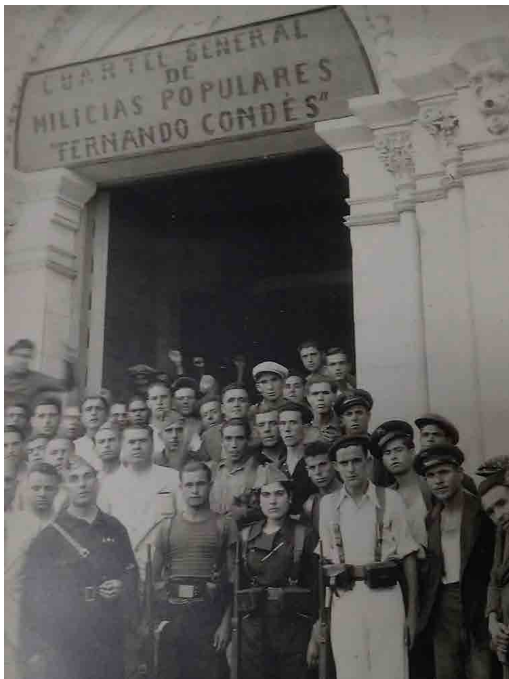
Voluntarios alistándose en el Cuartel General de Milicias Populares «Fernando Condés» -en la reconvertida iglesia de San Diego de Cartagena- durante los primeros días de la guerra civil española. Fecha: 23 de julio de 1936.