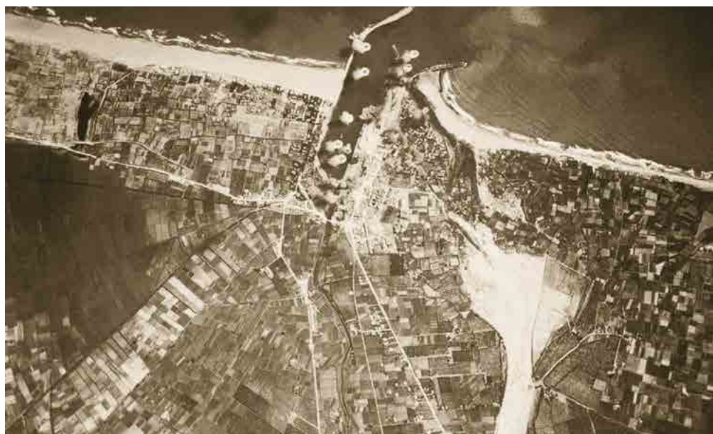
Bombardeo del puerto de Gandía. Fecha: 21 de enero de 1939.

Autor: Stato Maggiore Aeronautica Italiana. Fuente: Stato Maggiore Aeronautica Italiana.