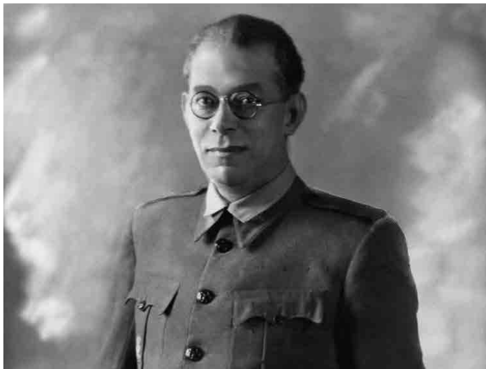
El General Emilio Mola. Fecha: 1930.