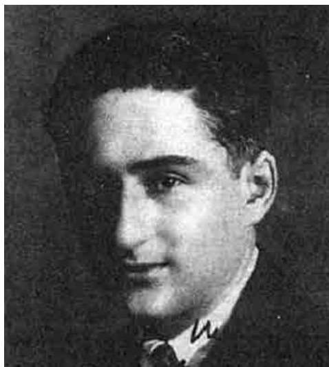
Fotografía del periodista y político Braulio Solsona, Gobernador Civil de Valencia. Fecha: Publicada en 1927. Autor: Desconocido. Fuente: Popular Film, número 24 de 13 de enero de 1927, página 6.