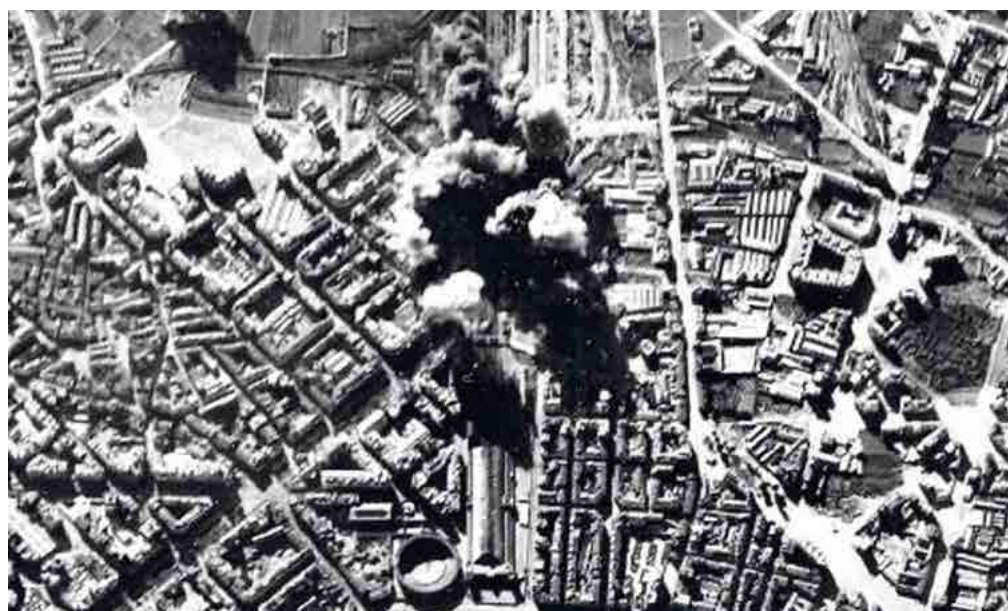
Bombardeo de la Aviación Legionaria italiana sobre la estación del Norte y el barrio de Ruzafa en Valencia. Fecha: 1937. Autor: Ufficio Storico della Aeronautica Militare. Fuente: Archivos libres de la Guerra Civil.

Autor: Stato Maggiore Aeronautica Italiana. Fuente: Stato Maggiore Aeronautica Italiana.