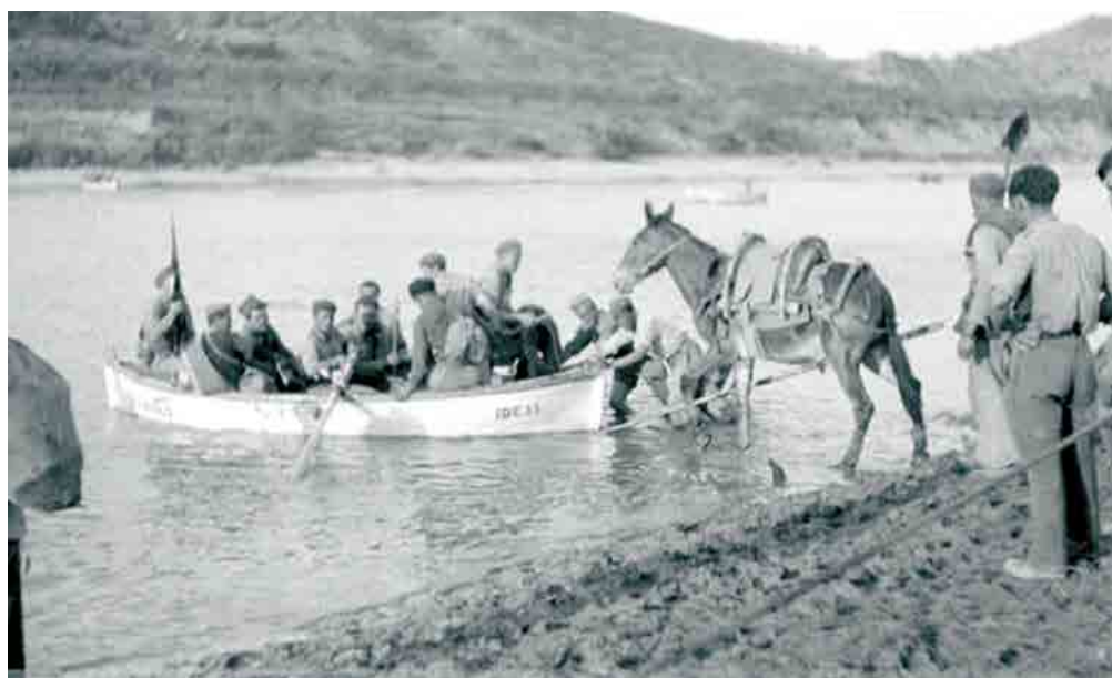
Tropas republicanas cruzan el Ebro. Fecha: 1938.