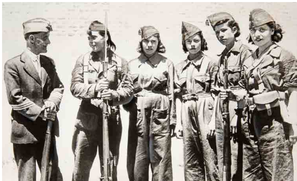
Mujeres soldado. Fecha: 1936. Autor: Desconocido. Fuente: Colección Museo Nacional Centro de Arte Reina Sofía.