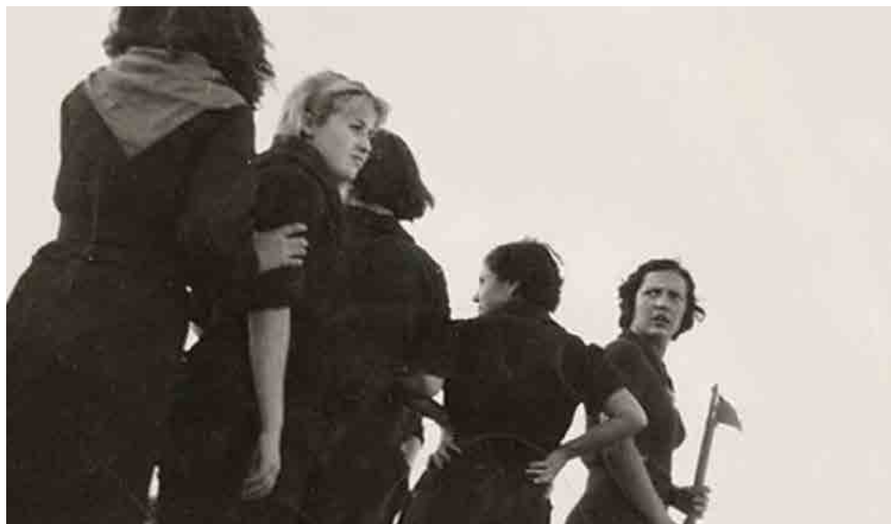
Grupo de mujeres milicianas en el frente en 1936. Fecha: 1936. Autor: Gerda Taró.

Fuente: https://www.nytimes.com/slideshow/2007/09/21/arts/20070922_TARO_SLIDESHOW_11.html .