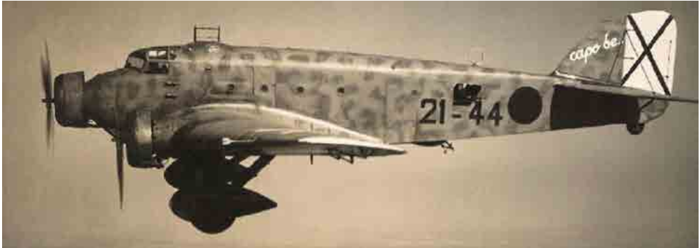
Savoia Marchetti SM.81 sobrevolando España. Fecha: 1936- 1939. Autor: Desconocido.