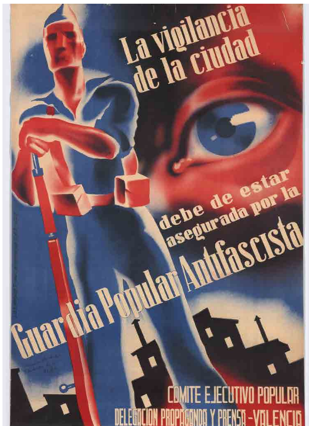
Cartel de la Guerra Civil: La vigilancia de la ciudad debe de estar asegurada por la Guardia Popular Antifascista. Fecha: 1936-1937. Autor: Desconocido.