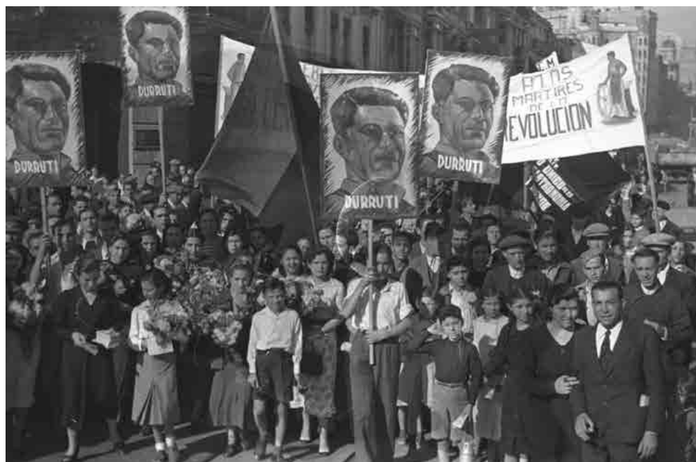
Homenaje a figura Durruti en Valencia. Fecha: 1936. Autor: Finezas. Fuente: Biblioteca Valenciana Nicolás Primitu – Col.lecció: BV Fondo gráfico – Ubicació: BFZ – Signatura: Fzas/24-34 Serie G.