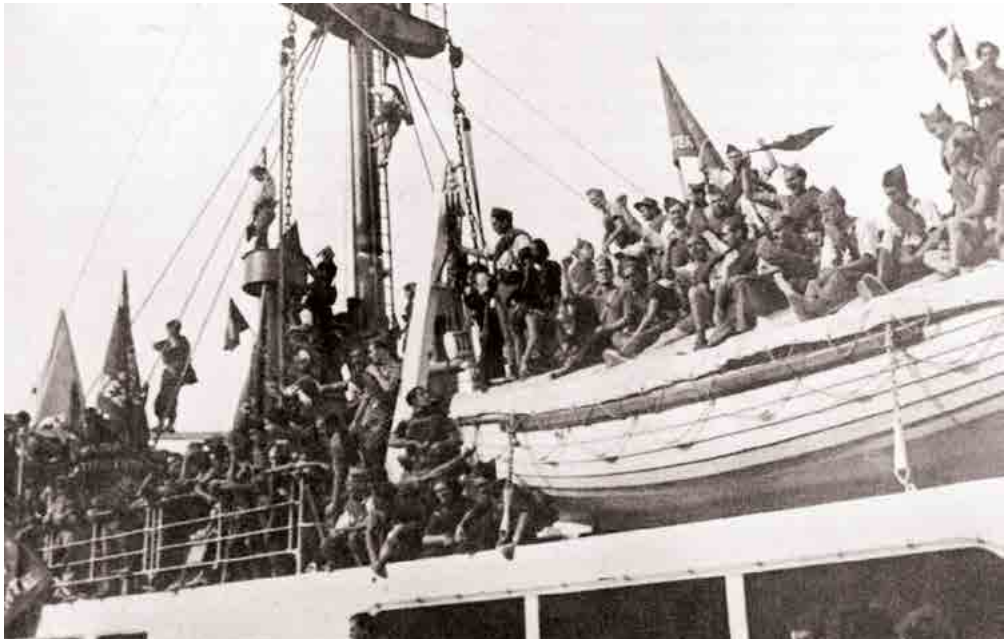
Tropas republicanas en la campaña de Mallorca. Fecha: 5 de agosto de 1936. Autor: Desconocido. Fuente: Mundo Historia.