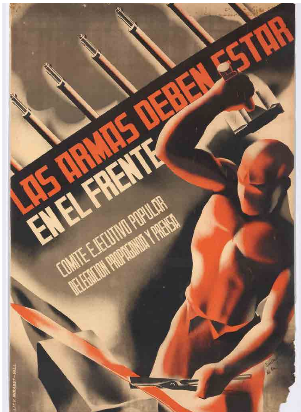
Cartel de la Guerra Civil. Las armas deben estar en el frente. Fecha: 1937. Autor: Desconocido.