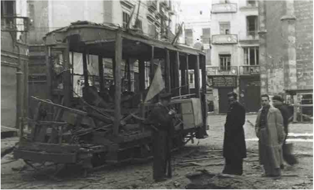
Bombardeos aeronavales de Valencia y poblados marítimos [Fzas/1-38 Serie K]. Fecha: 1936-1939.