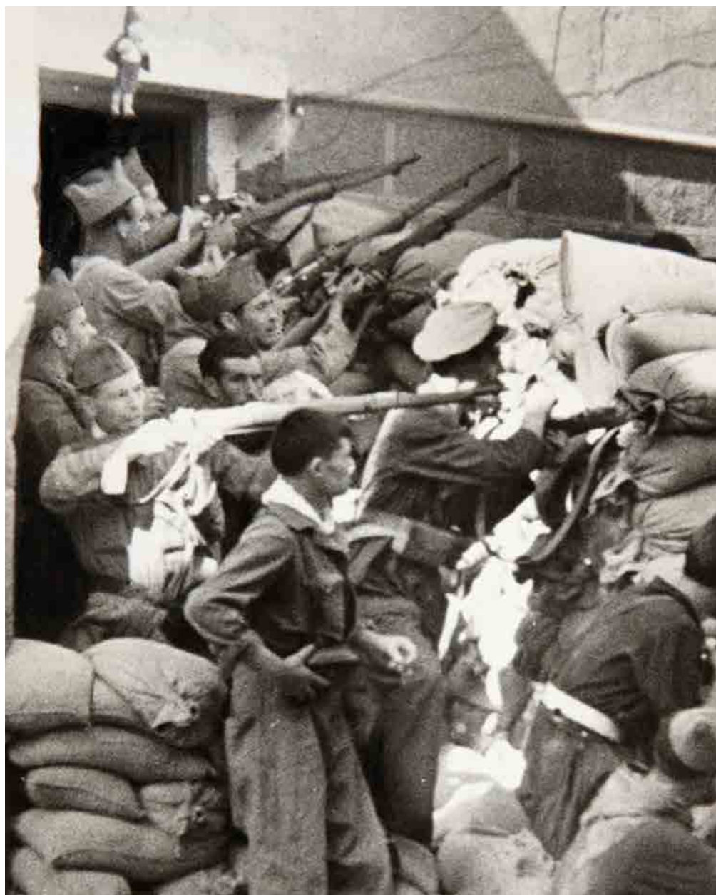
Soldados en la batalla, durante el Asedio del Alcázar de Toledo.

Fecha: 1936. Autor: Desconocido. Fuente: Colección Museo Nacional Centro de Arte Reina Sofía.