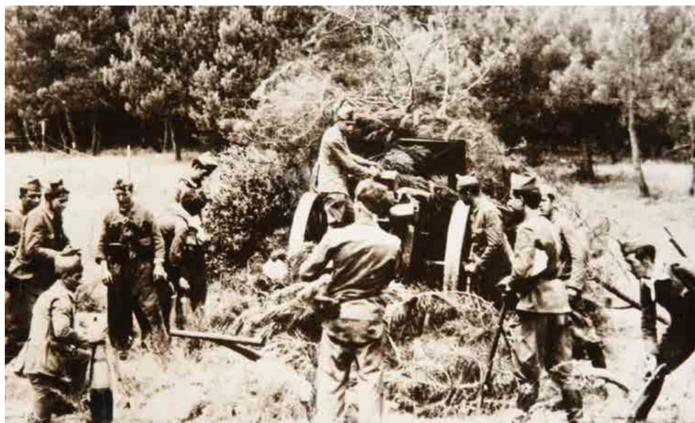
La artillería republicana. Fecha: 1936. Autor: Desconocido. Fuente: Colección Museo Nacional Centro de Arte Reina Sofía.