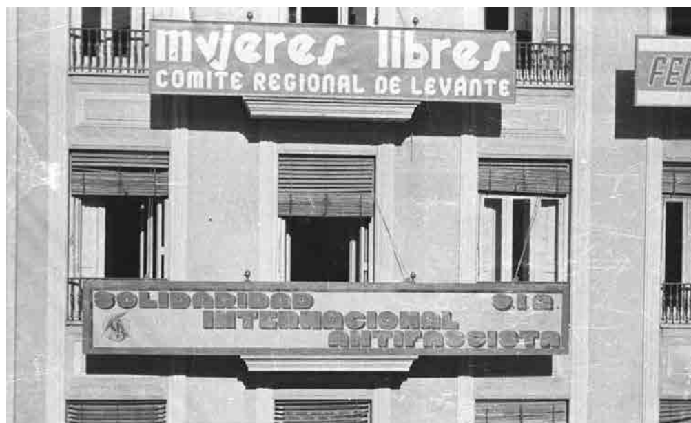
Sede del Comité Regional de Levante de Mujeres Libres. En la colección Vida ciudadana en Valencia capital (entre 1936 y 1939). Fecha: 1936-1939.