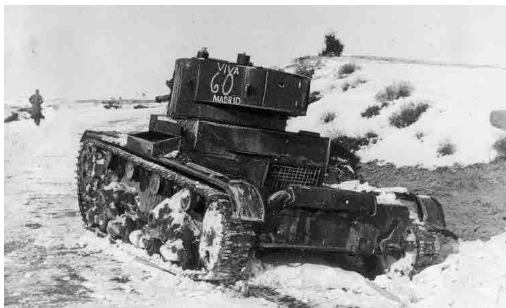
Tanque republicano T-26 durante la Batalla de Teruel. Fotografía retocada usando Photoshop CS6. Fecha: diciembre de 1937.