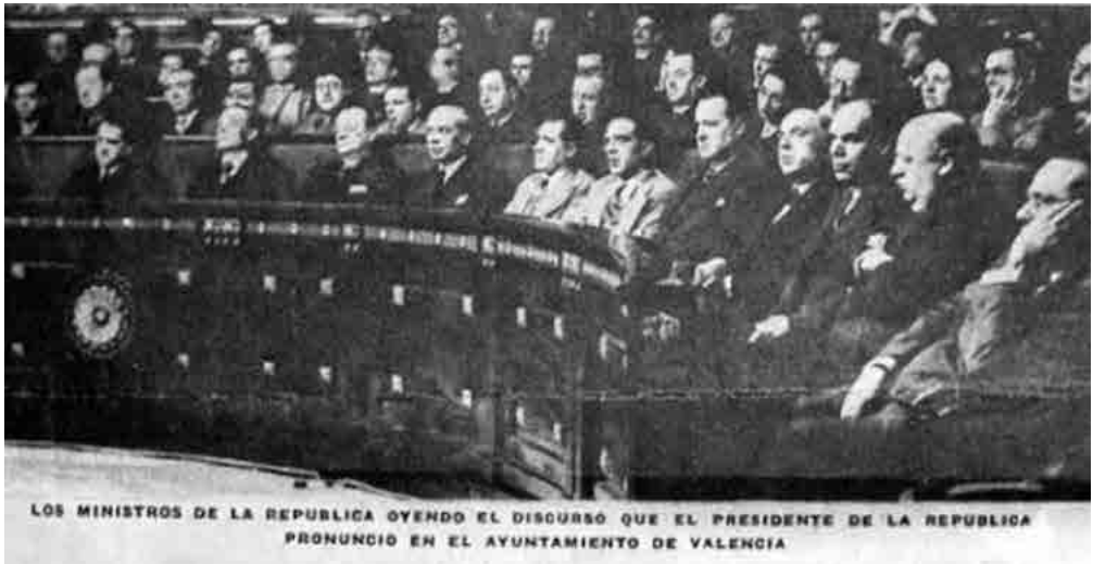
El Gobierno de la República reunido en el Ayuntamiento de Valencia. Fecha: 9 de noviembre de 1936.