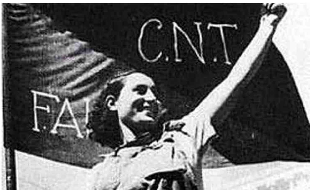
Mujer miliciana con la bandera de la CNT-FAI. Fecha: indeterminada. Autor: anónimo.

Fuente: https://espanamujeresyanarquismo.files.wordpress.com/2014/08/cntuna-miliciana-sin-temor-a-los-pacos-desplega-la-bandera-rojinegra-en-barcelona-en-julio-de-1936.jpg