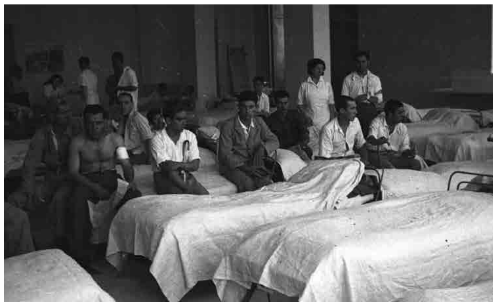
Hospitales de sangre y sus cuadros médicos, heridos. Fecha: 1936-1939.