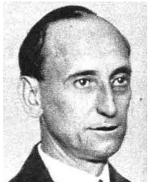
Presidente del Gobierno de la República, Santiago Casares Quiroga. Fecha: Desconocida.