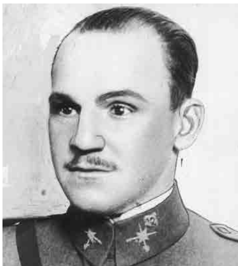
El General Manuel Goded Llopis. Fecha: Entre 1927-1936.