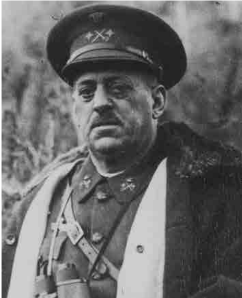
El General José Sanjurjo Sacanell. Fecha: 1928-1932.