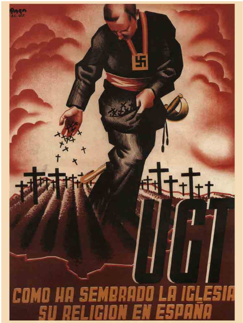
Cartel de la Guerra Civil: Como ha sembrado la Iglesia su religión en España. Fecha: 1936. Autor: Desconocido.