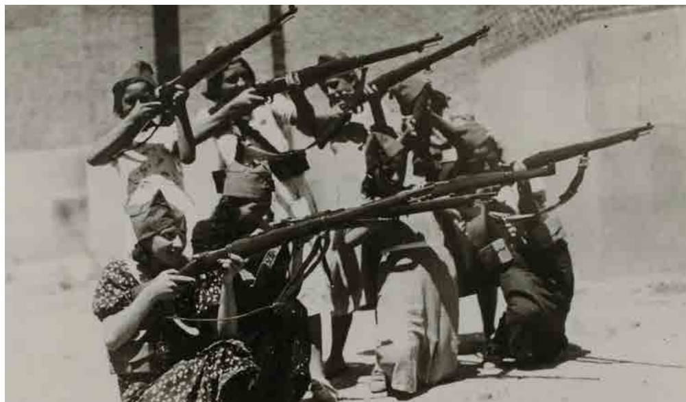
Un regimiento republicano de mujeres practica con fusiles en las calles de Madrid durante la Guerra Civil Española.