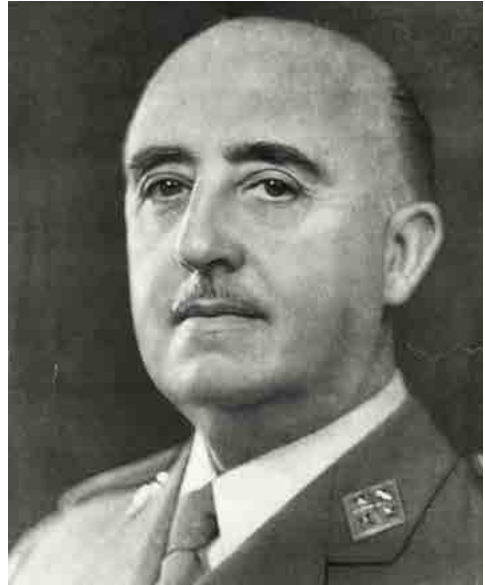
Retrato del Gral. Francisco Franco Bahamonde Fecha: Desconocida. Autor: Desconocido. Fuente: Biblioteca Virtual de Defensa