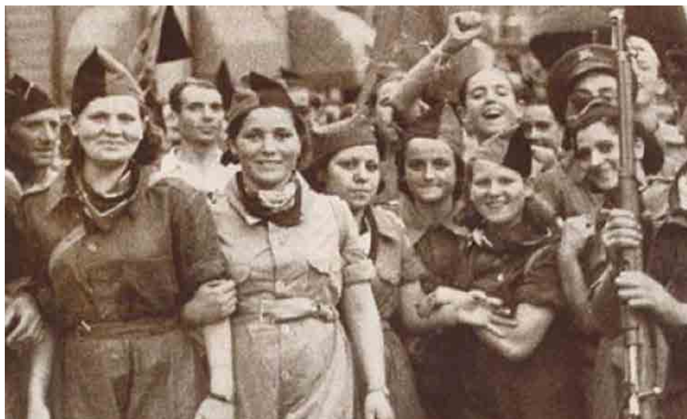
Grupo de mujeres milicianas de la CNT-FAI en Barcelona, julio de 1936. Fecha: julio de 1936. Autor: anónimo. Fuente: http://madrid.cnt.es/historia/