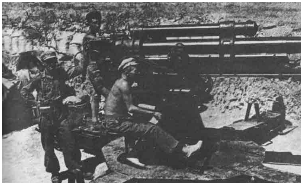
Artillería republicana en la batalla del Ebro. Fecha: 1938. Autor: Desconocido. Fuente: Československý rok 1938.