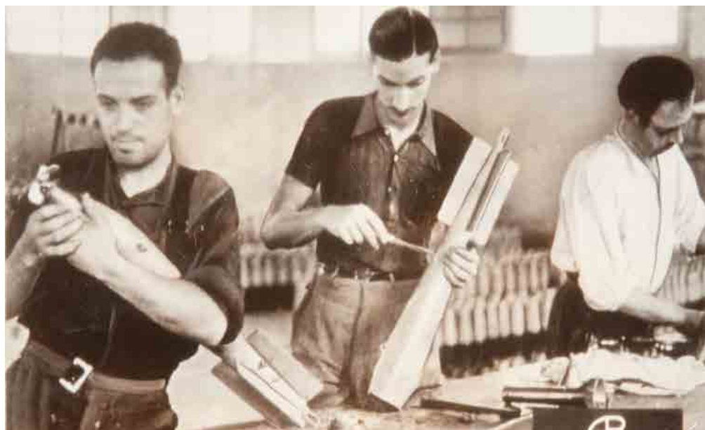
Republicanos fabricando bombas. Fecha: 1937. Autor: Desconocido. Fuente: Colección Museo Nacional Centro de Arte Reina Sofía.