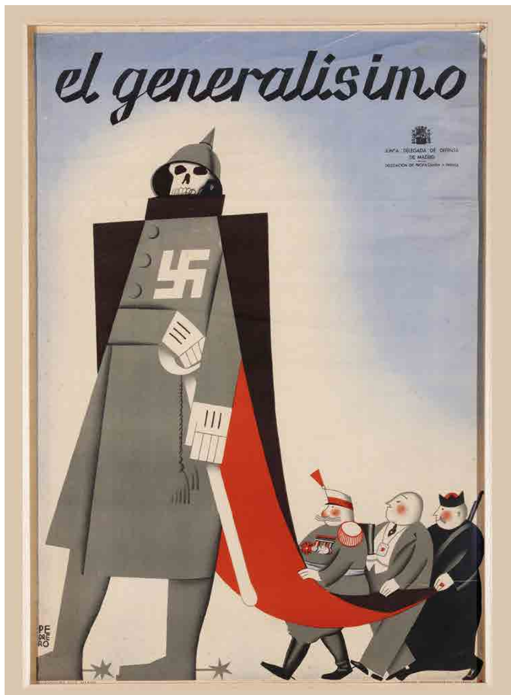
Cartel de propaganda de la Guerra Civil. Fecha: 1937-1938. Autor: Desconocido.

Fuente: https://artsandculture.google.com/asset/civil-war-poster-39-unknown-signed-by/9wEp8tQwGhpLuvv .