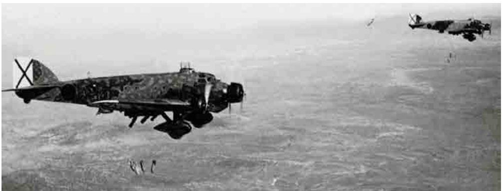
Una escuadra de Savoia Marchetti SM.81 bombardeando la costa mediterránea. Fecha: 1936. Autor: Desconocido. Fuente: http://www.finn.it/regia/html/guerra_civile_spagnola.htm .