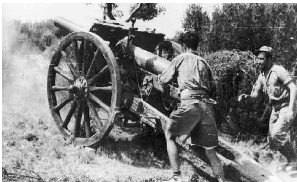
Artillería republicana. Fecha: octubre de 1937. Autor: Concern Illustrated Daily Courier - Archivo de ilustraciones. Fuente: Narodowe Archiwum Cyfrowe, Polonia.