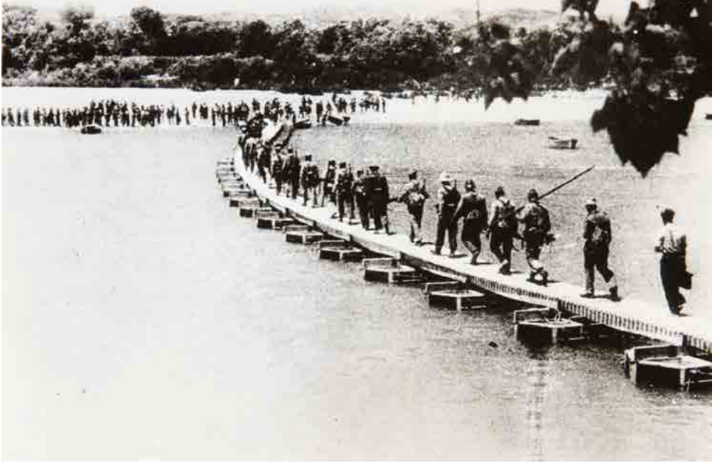
Soldados republicanos en la batalla del Ebro.

Fecha: 1938. Autor: Desconocido. Fuente: Colección Museo Nacional Centro de Arte Reina Sofía.