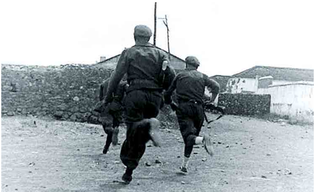
Soldados republicanos en el Frente de Teruel. Fecha: junio de 1937. Autor: Gerda Taro. Fuente: https://www.nytimes.com/slideshow/2007/09/21/arts/20070922_TARO_SLIDESHOW_7.html .