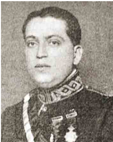
José Calvo Sotelo (1893-1936), con uniforme del Cuerpo de Abogados del Estado. Fecha: 1930.