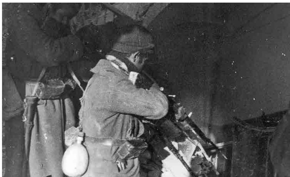
Soldados republicanos en los combates casa por casa que se desarrollaron durante la Batalla de Teruel. Diciembre de 1937. Autor: Anónimo. Fuente: Narodowe Archiwum Cyfrowe, 1-E-6905.