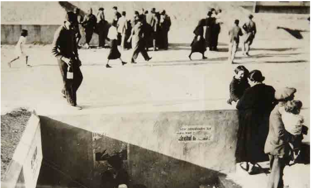
Los refugios antiaéreos republicanos ayudan a combatir los ataques aéreos, Castellón. Fecha: 1938.