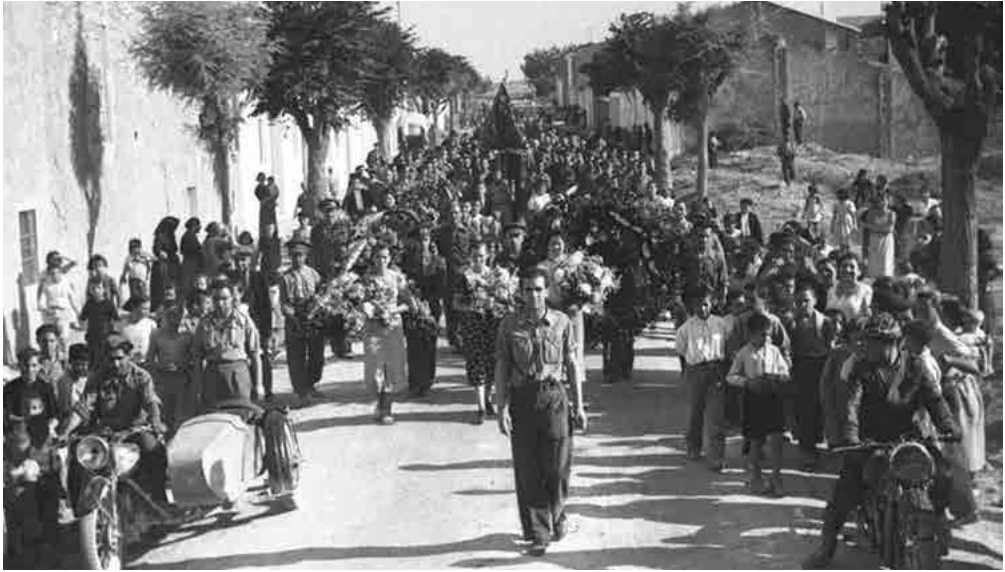
Entierro de un capitán en el cementerio del frente de Teruel. Fecha: 1936-1939.