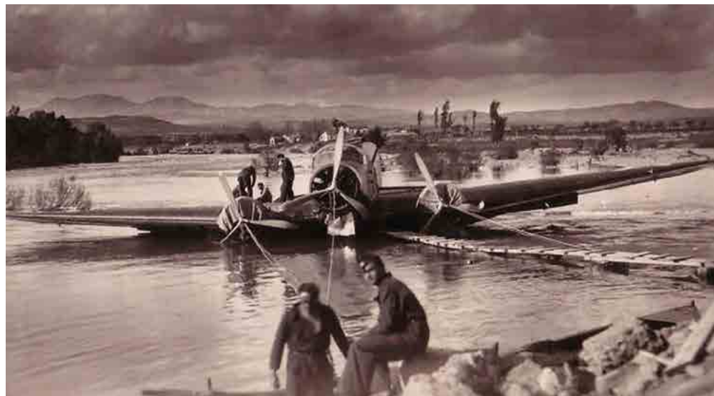
Personal recuperando un Savoia Marchetti SM.81 tras un aterrizaje forzoso en un río. Fecha: 1936. Autor: Desconocido. Fuente: http://www.finn.it/regia/html/querra_civile_spagnola.htm .