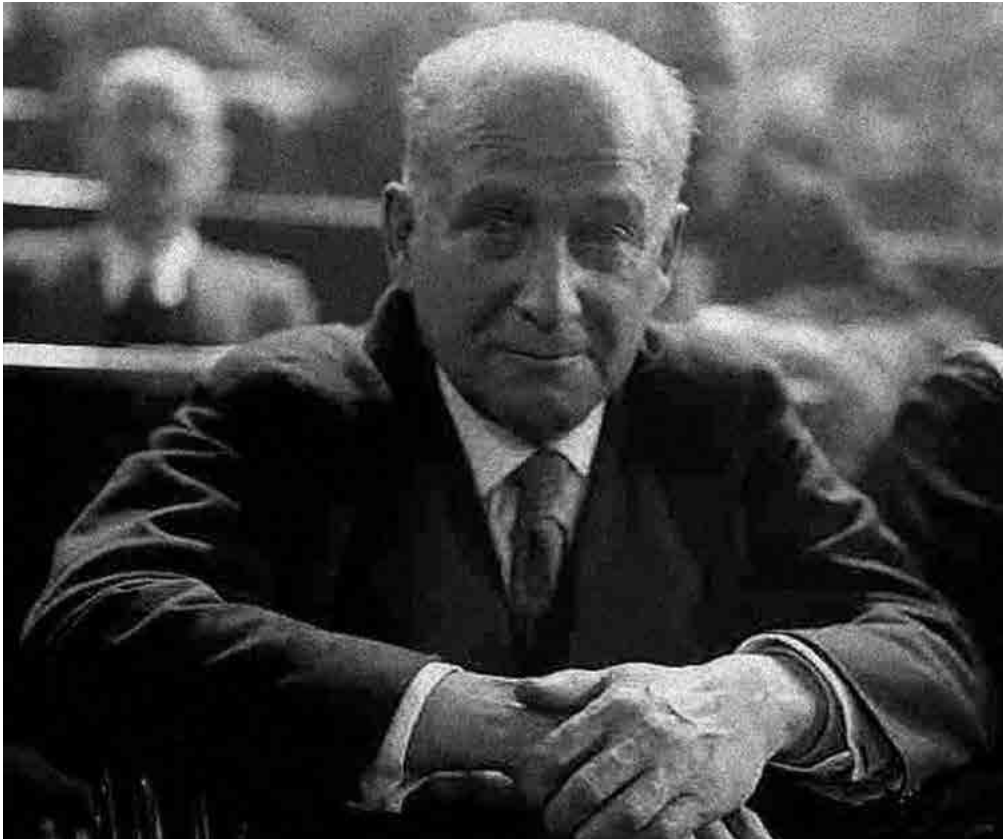
Francisco Largo Caballero El presidente del gobierno de la república del 04-09-1936 al 17-05-1937. Fecha: agosto de 1936. Autor: Desconocido. Fuente: Ilustrowany Kurier Codzienny, Cracovia, Polonia.