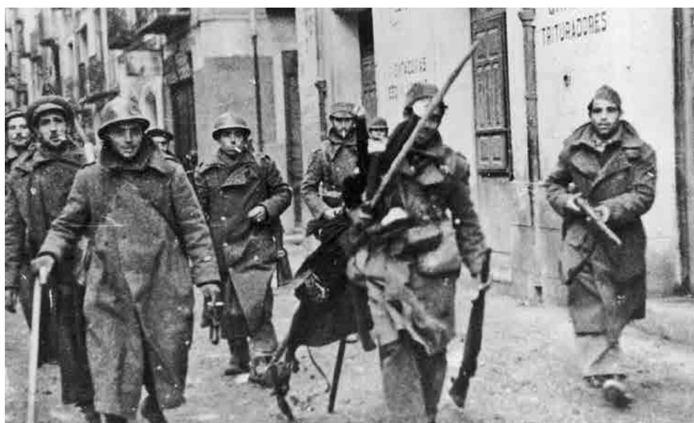
Soldados republicanos en las calles de Teruel, durante la conquista de la ciudad. Fecha: diciembre de 1937.