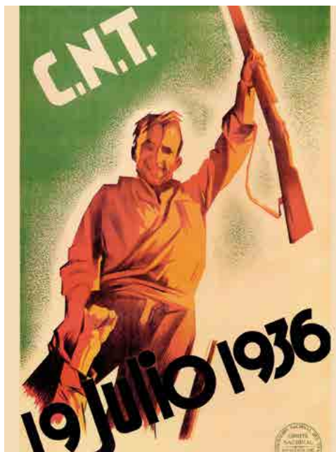
Cartel de la Guerra Civil española. Fecha: 1936. Autor: Desconocido.