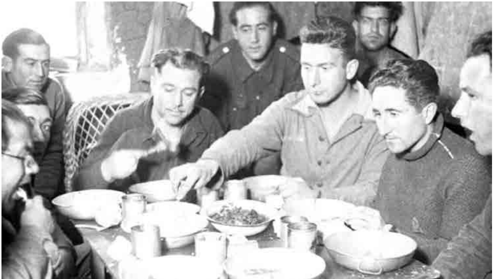
Estados mayores de estrategia. Fecha: 1936-1939.