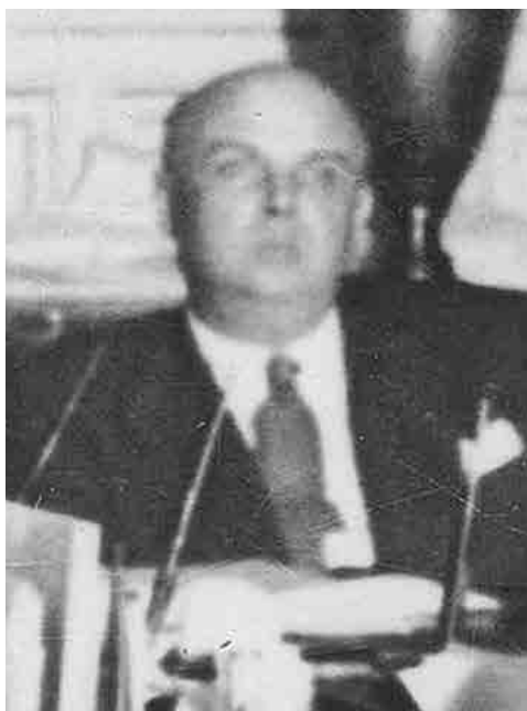
Mariano Ruiz-Funes, Ministro de Agricultura del 16 de febrero al 19 de julio de 1936. Fecha: septiembre de 1936.