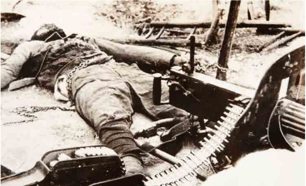
Voluntario abatido. Fecha: 1937. Autor: Desconocido. Fuente: Colección Museo Nacional Centro de Arte Reina Sofía.