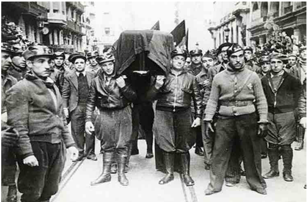
Entierro de Buenaventura Durruti en Barcelona. Fecha: 23 noviembre de 1936. Autor: Desconocido. Fuente: http://forget.e-monsite.com/pages/portraits/durrutti-sa-colonne-la-liberation-de-paris-et-la-cnt.html .