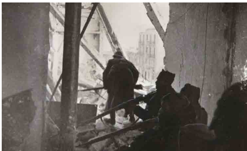
Republicanos frente a la contraofensiva franquista de Teruel. Fecha: enero de 1938. Autor: Desconocido. Fuente: Colección Museo Nacional Centro de Arte Reina Sofía.