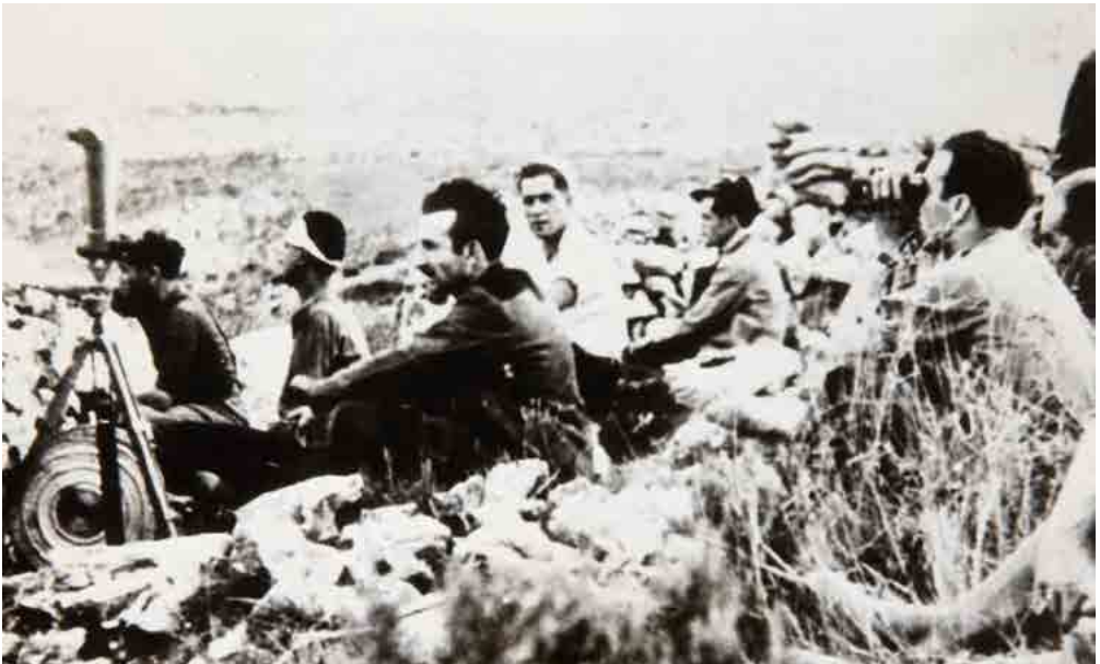
Puesto de observación para la prensa.

Fecha: 1938. Autor: Desconocido. Fuente: Colección Museo Nacional Centro de Arte Reina Sofía.